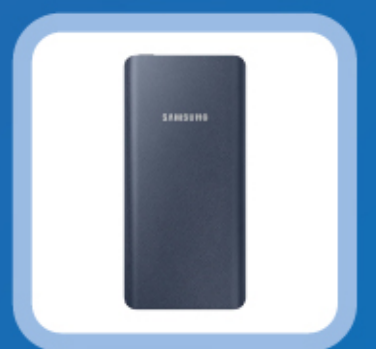
참가자 전원 증정 보조배터리