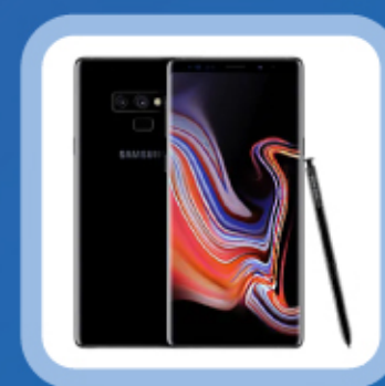
경품 추첨 1등 삼성전자 갤럭시 노트9