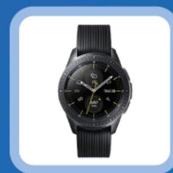
경품 추첨 2등 삼성전자 갤럭시 워치