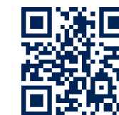
카카오톡 플러스 친구에서 대림산업 채용을 확인하세요.