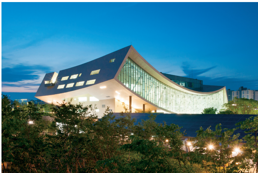
국립 세종도서관 Sejong National Library

회사를 선택한다는 것. 당신의 미래를 결정하는 중요한 선택입니다. 75년의 시간 동안 업계 최고의 위상을 지키며 끊임없이 성장해온 대림. 이제 글로벌 시장을 무대로 또 다른 미래를 준비하고 있습니다.