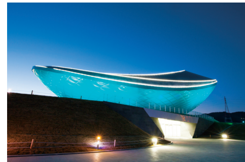
디아크 The ARC

대림그룹은 국내외에서 건설 부문과 석유화학 부문을 선도하는 대림산업을 주력으로, 총 13개 관계사와 교육 및 문화기관으로 이루어진 대한민국 재계 17위의 대표 그룹입니다. 건축, 토목, 플랜트에서 석유화학, 정보통신, 레저, 자동차, 교육, 문화 등에 이르기까지 대림그룹은 대한민국은 물론 세계인들의 생활과 깊은 관련을 맺고 있으며, 최고의 가치를 제공함으로써 고객들의 더 나은 삶을 이루는 것을 기업이념으로 삼고 있습니다.