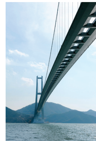
이순신 대교 Yi Sun-Shin Bridge

대림그룹의 모태가 되는 대림산업 건설사업부는 75년 역사를 지닌 국내 최장수 건설사로서 경부 고속도로, 서울지하철, 포항제철, 세종문화회관, 국회의사당, 잠실 올림픽 주경기장, 독립기념관, 서해대교, 청계천, 광화문광장 등 주요 국가기반 사업을 수행했습니다. 국내최초 아파트 브랜드 e편한세상을 선보였으며, 해외에서도 1966년 베트남에 최초로 진출한 이래 세계 26개국에서 토목, 건축, 플랜트의 다양한 프로젝트를 성공적으로 수행하여 명실상부한 대한민국 대표 건설사이자 글로벌 기업으로 인정받고 있습니다.