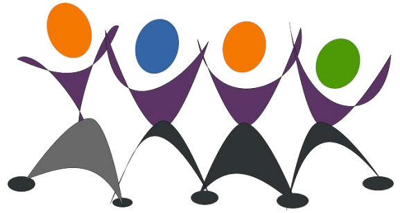
< 사용자 식별 >