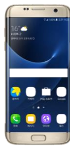
〈삼성 Galaxy S7〉