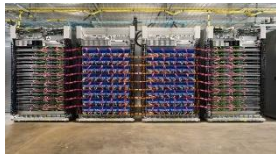
딥 러닝 특화 시스템