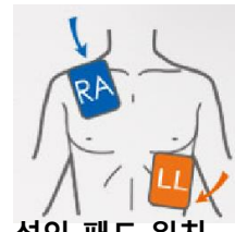
성인 패드 위치