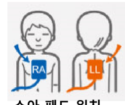
소아 패드 위치

* 7세 이하 소아 적용 시, 심장충격기를 소아 전환 버튼을 누른 후 소아 패드 부착 위치에 패드를 각각 부착합니다.