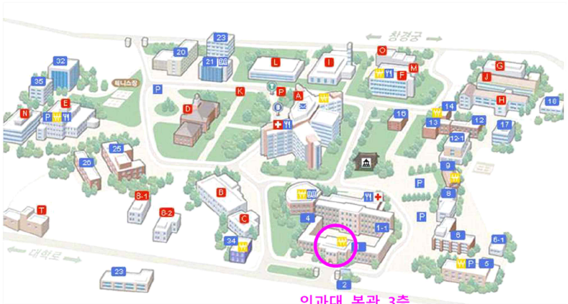
의과대 본관 3층 대강당(안전환경교육장)